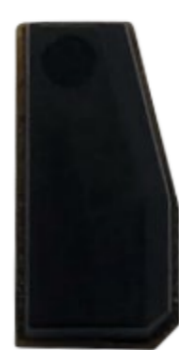
T5 Virgem (ID20)

Essa função realiza a programação de chaves clonando a primeira chave diretamente do arquivo nos veículos com o sistema Caixa Amarela Delphi 93C46.