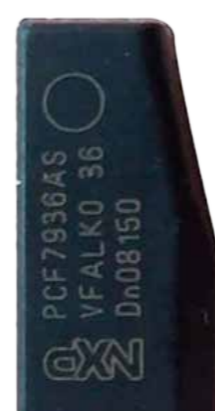
PCF7936 VIRGEM (T19)

Essa função realiza a leitura de arquivo e programação da primeira chave nos veículos com o sistema Keyless 1 OMRON 24C16.