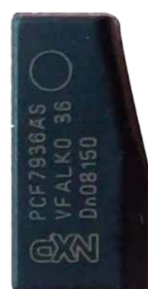
PCF7936 VIRGEM (T19)

Essa função realiza a leitura de arquivo e programação de chaves clonando a primeira chave diretamente do arquivo nos veículos com o sistema Keyless 1 24C16.