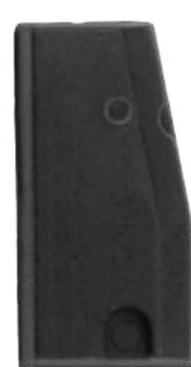
KD46/CN3 (ID46 Clonável)

Essa função realiza a leitura de arquivo e programação de chaves clonando a primeira chave diretamente do arquivo nos veículos com o sistema ECU Keihin 95128.