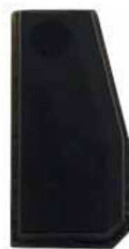
T5 Virgem (ID20)