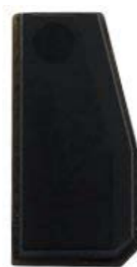
T5 VIRGEM (ID20)

Essa função realiza a programação de chaves clonando a primeira chave diretamente do arquivo nos veículos com o sistema FFR Continental 25256.